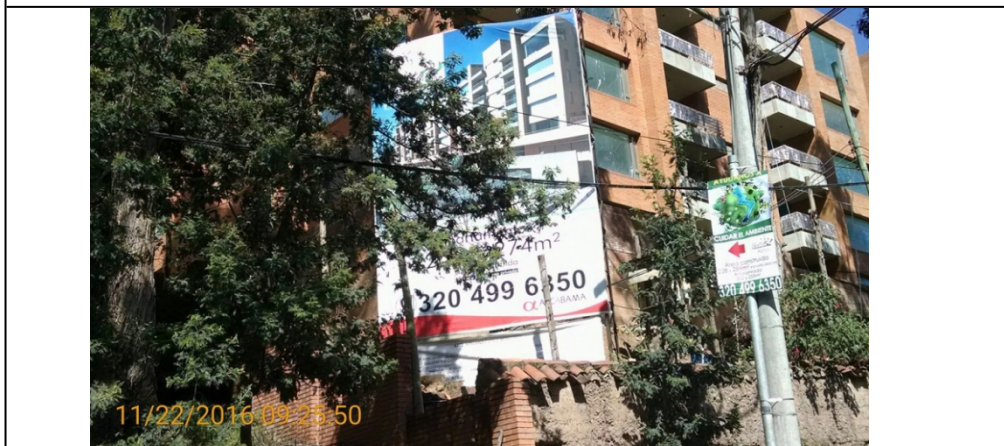
FOTOGRAFIA 1 : vista del Elemento tipo valla de obra instalado en el predio ubicado en la CARRERA 76 No 152 B 77