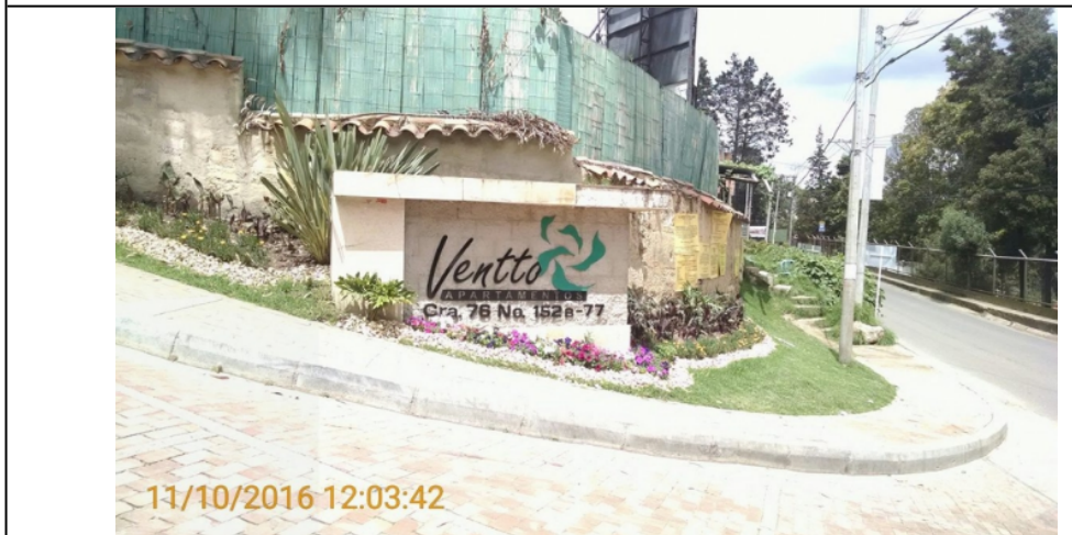
FOTOGRAFIA 2 : vista nomenclatura CARRERA 76 No 152 B 77