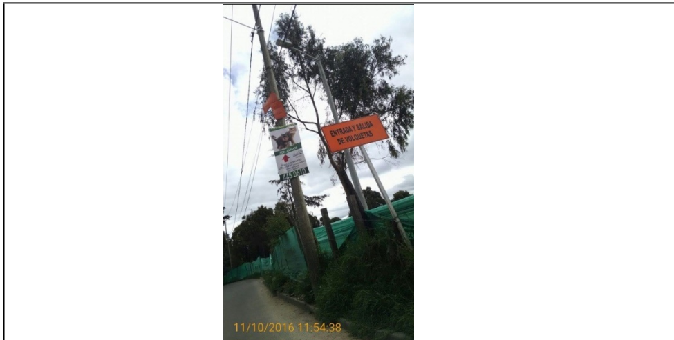
FOTOGRAFIA 3: Pendón Comercial instalado en poste de apoyo a la red electrica y telefonica.

ALCALDÍA MAYOR DE BOGOTÁ D.C. SECRETARÍA DE AMBIENTE