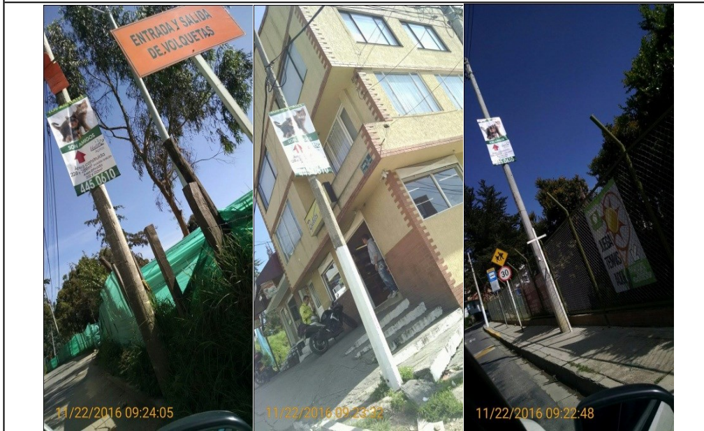
FOTOGRAFIA 3: Pendones Comerciales instalados en postes de apoyo a la red electrica y telefonica.